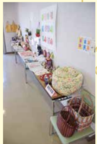
女性部員の皆さんが活動を通して作った作品が会場を華やかに彩りました。