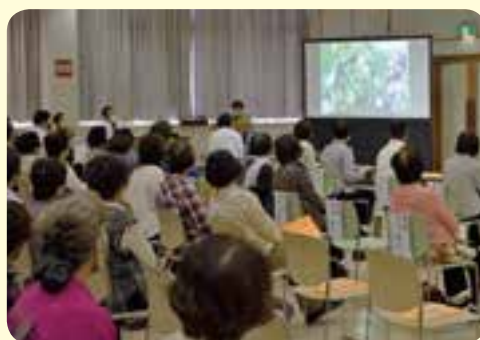
青壮年部が作った1分間動画。上映が終わると大きな拍手に包まれました。