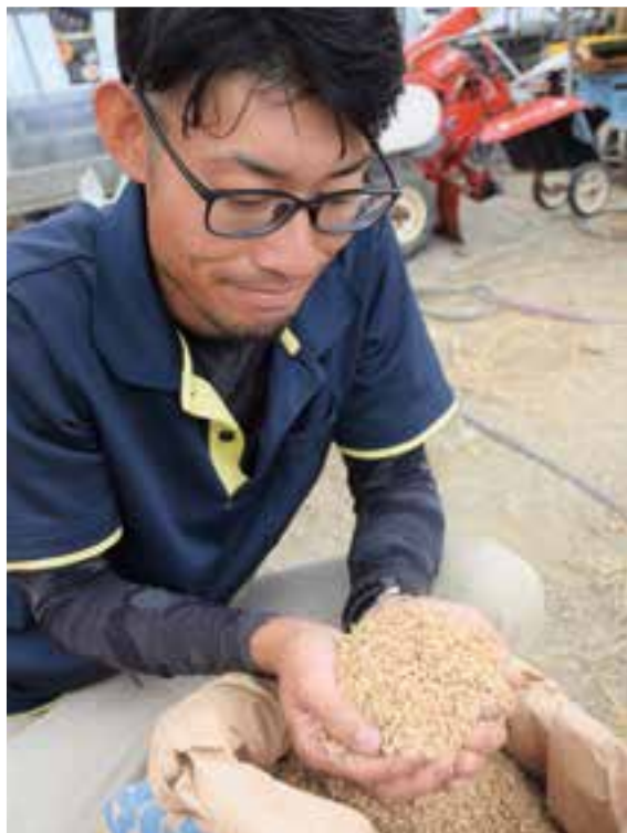
敷き藁代わりに使用する籾殻も、減農薬・無農薬栽培の農家さんから仕入れて安心・安全にこだわっています。