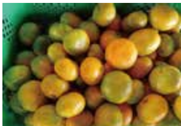
おいしいみかんができました。

9月下旬から西支所管内で普通作水稻の稲刈りが行われました。JA担当者によると、今年は天候に恵まれて品種によっては多少の違いがあるものの、昨年比で豊作の見通しで数量も上回る見込みとのこと。近年、高温障害による品質の低下もさげばれていますが食卓に美味しいお米が並ぶ事を祈ります。