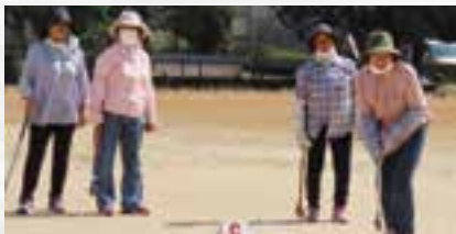
プレーを楽しむ女性部員