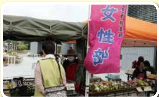
10月1日：上天草市の新しい市立図書館「本と歴史の交流館イコト」のオープンイベント