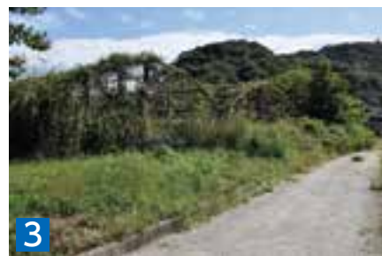
3 土地(宅地) 3848.30㎡ 天草市深海町字新田4362番1 ※建物有(3連棟ハウス) 土地(公衆用道路)121.00㎡ 天草市深海町字新田4362番3