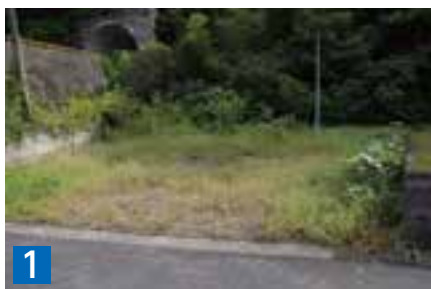
1 土地(宅地) 197.33㎡ 天草市河浦町崎津字中野迫 1154番2

※原則として現状のままでの引き渡しとなりますが、既存建物等の対応についてはご相談ください。