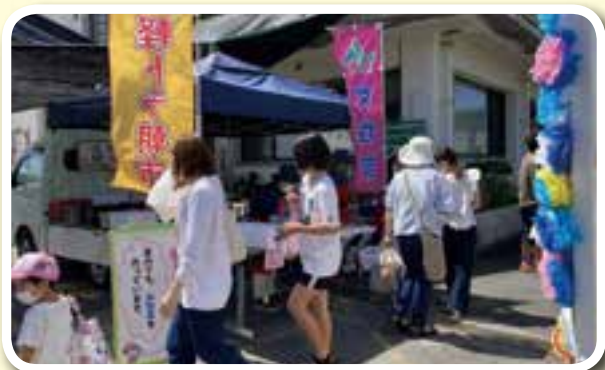
8月27日：社会福祉協議会主催の「ふれあい広場」