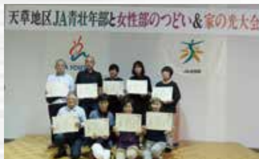
家の光永年購読者表彰者