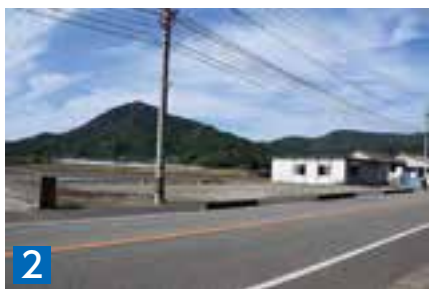
2 土地(宅地) 487.11㎡ 天草市河浦町河浦字一本松1番2 ※建物有(旧河浦葬祭センター) 土地(宅地) 505.03㎡ 天草市河浦町河浦字一本松1番14