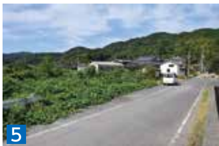
5 土地(雑種地) 250.00㎡ 天草市二浦町亀浦字浜口 1019番18