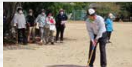
共にプレーする崎本組合長