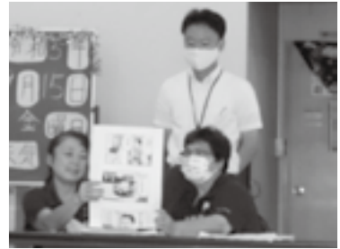
家の光紙芝居披露する女性部員