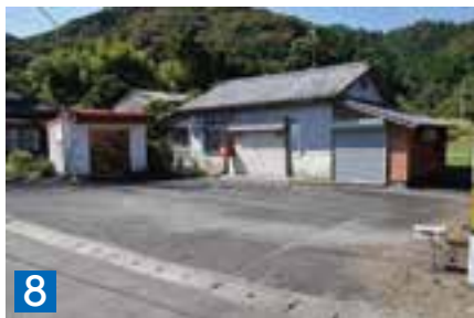
8 土地(宅地) 320.20㎡ 天草市深海町字前田2336番 ※建物有(旧下平簡易局)