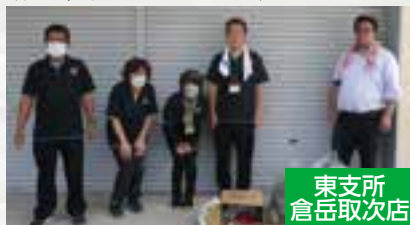
東支所 倉岳取次店