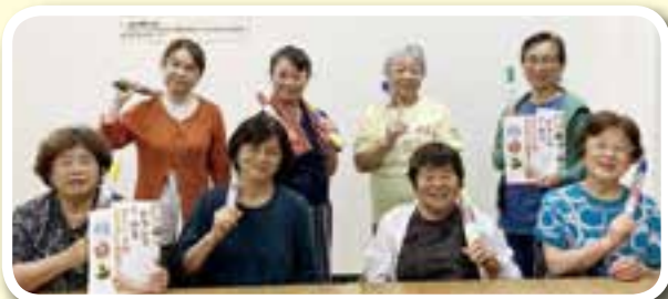
7月4日：4月号の肩たたき棒作り

大矢野総支部では支部長・副支部長さんを対象に奇数月に家の光定例会を行っています。