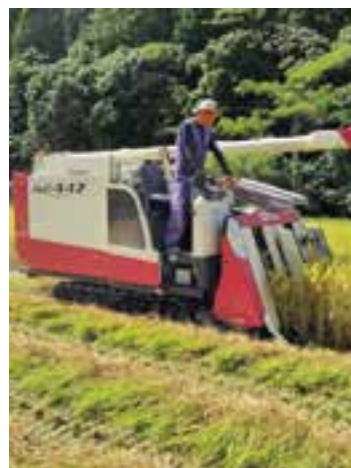
河浦町葛河内地区

また、今年は極早生みかんも豊作で生産者は9月から10月にかけて出荷に追われています。昨年が天候不良の影響もあり数量も8トンと少なめでしたが、今年は収穫量約10トンを計画しています。酸味と甘味のバランスが良く、とても美味しい仕上がりとなっています。