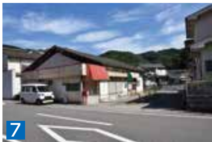
7 土地(宅地) 447.18㎡ 天草市牛深町字井手迫1637番2 ※建物有(旧茂串簡易局)