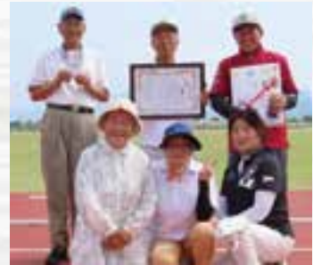
団体2位の大矢野Bチーム