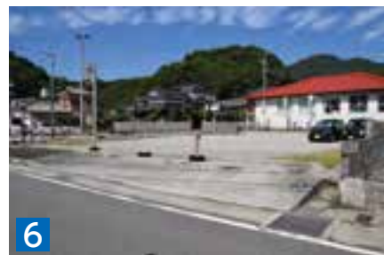
6 土地(宅地) 436.21㎡ 天草市久玉町字村田1392番1 ※旧久玉支所跡