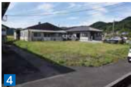
4 土地(雑種地) 504.00㎡ 天草市二浦町亀浦字浜口1035番44 ※建物有(旧農産加工センター)