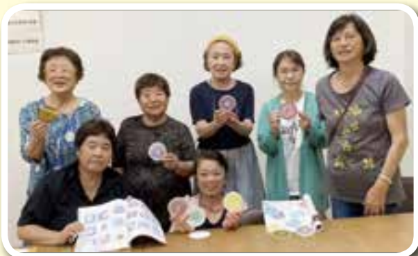
9月5日：8月号の糸かけアート作り