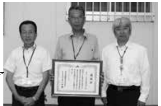
感謝状を持つ共済部安心サポーター

安心サポーターから一言 ドライブレコーダーの設置を おすすめします。 事故発生時、設置の有無でその後の、 事故処理が断然違います。