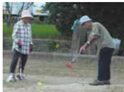
プレーする年金友の会会員