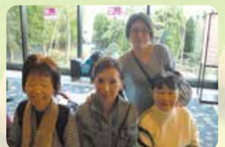
仲よし同級生グループ

来年は秋に北海道第2弾で道東方面を計画しております。皆様のご参加をお待ちしております。