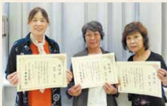
笑顔で賞状を持つ購読者