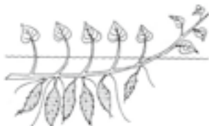
図 サツマイモの付き方