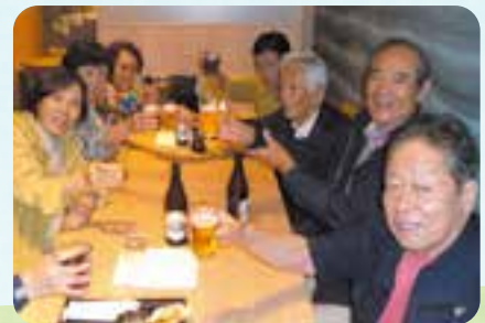
金婚グループで乾杯