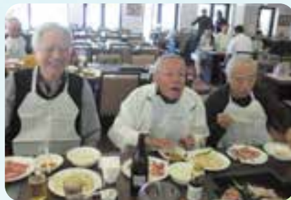
新和町の旧友と参加しました。