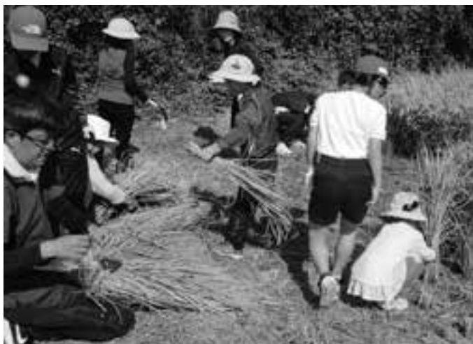
鎌で稲を刈る児童

天草市倉岳地区の棚底青壮年部は10月1日、天草市立倉岳小学校1年生と5年生17人に稲刈りを指導しました。児童らに学校裏の2反の田んぼで稲「くまさんの輝き」を鎌を使って刈り取らせ、刈り残った稲はバインダーを使って刈り、手作業と農業機械での違いを見せました。