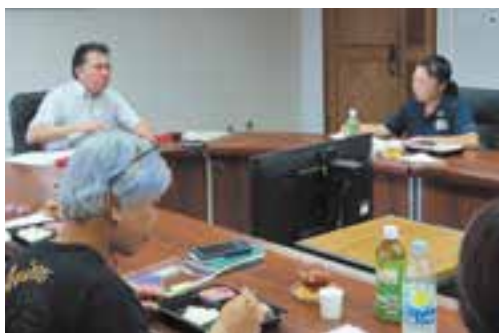
ランチをとりながら女性部員の話聞く市長

また、同女性部は10月6日に開かれた上天草市制施行20周年記念式典にて市制発展に寄与したとして功績表彰を受けました。