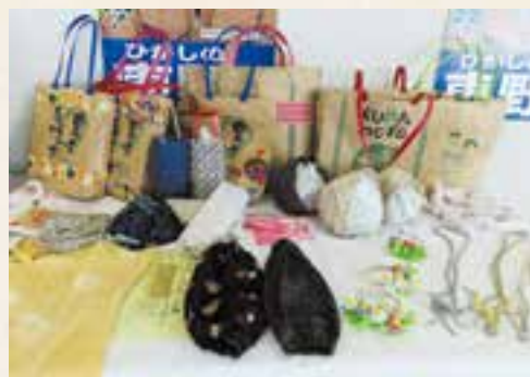
各支部から寄せられた「家の光」を活用した手芸品や絵手紙などの作品