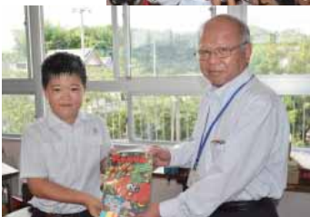
▶ちやぐりんを贈呈