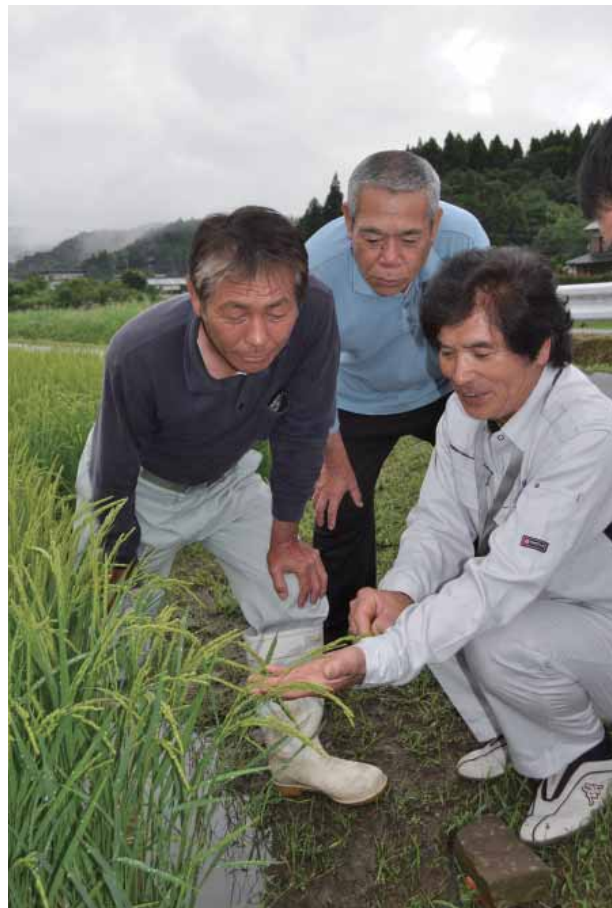
今年の稲の状況を確認しています

農家の皆さんいつもありがとうございます。 これからもおいしいお米を作ってください。