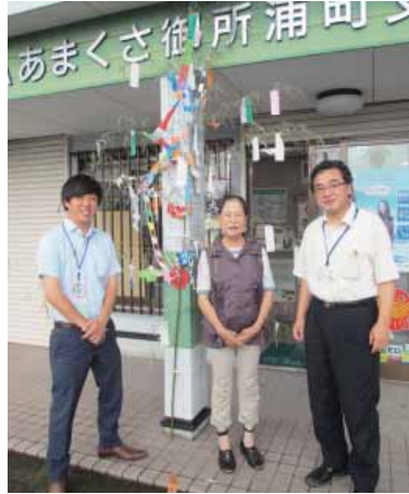
▲ありがとうございました

ていました。なかでも、「一日一回褒めること。人も褒めること」なども書かれていました。