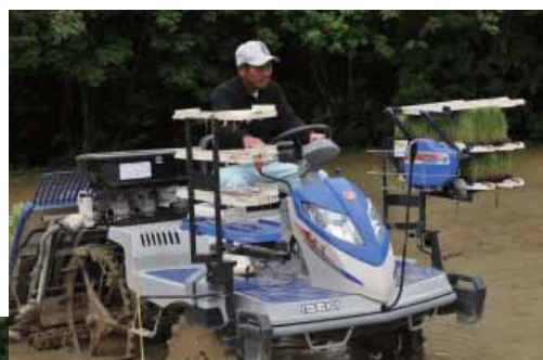
代掻きや植付けなども行います