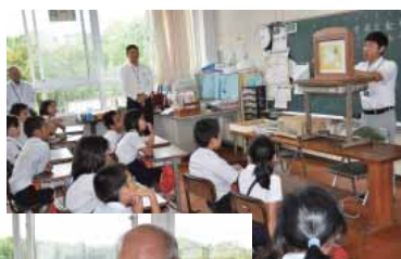
▶食への大切さを紙芝居で披露

また、食べ物や農業の大切さを児童に分かりやすく教えるため、職員による「紙芝居」を披露しました。