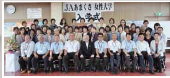
第11期の女性大学入学式

J A事業に参加・参画する女性と地域女性が生活・健康・美容・環境問題・地産地消・食育などについて共に学び合い、いきいきとした地域づくりと、心豊かに生活するために教養を深める事を目的としています。