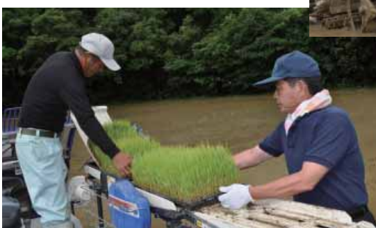
約10畝の圃場に飼料用稲を植えます