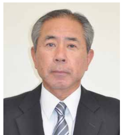
代表理事常務 信用担当