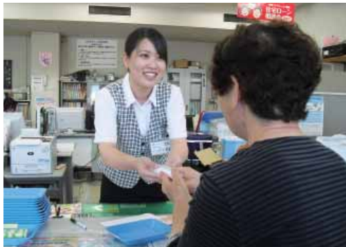
▶窓口で冷たいおしほりを渡す職員(松島支所)

これまで年金受給日には粗品をプレゼントしていたが、2年前から佐伊津・天草支所などで冷たいおしほりのサービスが好評で全支所で取り組むことになりました。