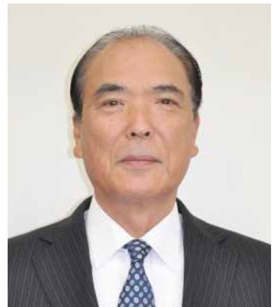
代表理事副組合長

29年度から31年度までJA自己改革の集中期間として組織改革を含め、早急に取り組んで参りますので、ご支援の程を宜しくお願い致します。