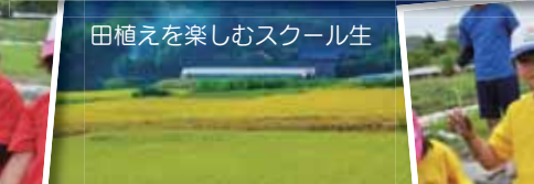
田植えを楽しむスクール生