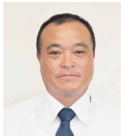
代表理事常務 経済担当

しかしながらJAは自主・自立の組織であるため、原点到ち返り、営農指導・販売を強化し農家所得の向上を図り、組合員・皆様のご期待に応えるべく、役職員一丸となって取り組んで参りますので、尚一層のご指導とご協力をよろしくお願い致します。