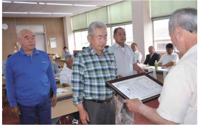
▼表彰を受賞した部員