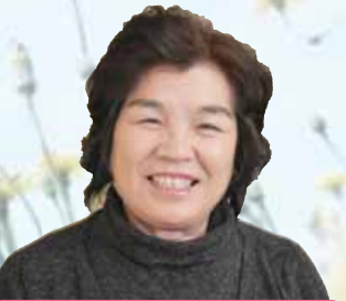
インタビューにお応えいただいた