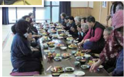
女性部員手作りの料理を楽しみました