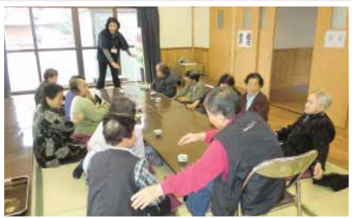
みんなゲームで盛り上がりました

J A あまくさ管内は、西日本でもトップクラスの品質を誇る加温インゲンの出荷が順調に進んでいます。10月から露地、11月から無加温ハウスもの、12月下旬から加温ハウスものが順次出荷され、現在（取材日1月15日）は2番果のピークに入りました。2005年からJ A で統一している出荷規格に沿った厳格な選別と、丁寧な箱詰めが市場や消費者から高い評価を得ており、平年より高単価での取引が続いています。 生産者の意識は高く品質はもちろん、出荷に対しても高い。集送センターの検査では、どの箱を開けても隙間なく揃えてあり、さや先端まで揃えて箱詰めされている徹底ぶり。市場関係者は、「キレイに並べているので袋詰めしやすい。」と評価。また、環境に配慮した天敵農薬を導入し害虫防除に取り組んでいます。コナジラミは散見されたが、大きな問題はなく、生育は順調。J A 指導員は「気温が高くなるにつれ病害虫に注意し、良質なインゲンをお届けしたい。」と話しました。