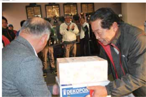
笑顔で賞品を受け取る参加者

J A あまくさは1月10日、ザ・マスターズ天草コースで「第19回J A あまくさ杯」を開催しました。参加者同士の親睦と融和を図るため開催し、当日は40組170名の方々にご参加いただきました。天候も良く、日中の気温も高いなかで、参加者は白熱したプレーを展開しました。 表彰式では協賛頂いた企業・団体からの賞品などが多数並び、当選者には喜びの笑顔が見られました。また参加賞にJ A あまくさ管内で栽培され、天草冬野菜の特産物として奨励中の野菜を詰めた「天草旬の野菜セット」を配りました。 多数の方にご参加頂き、誠にありがとうございました。