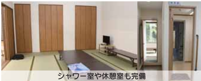
シャワー室や休憩室も完備