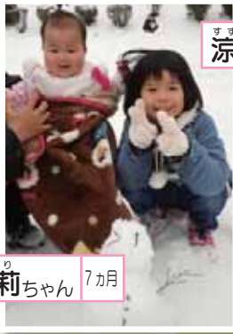
あいり 愛莉ちゃん 7ヵ月