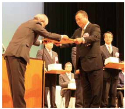
表彰を受けた下田常務