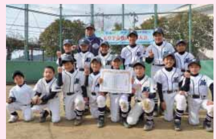
3位=本渡マリーンズ