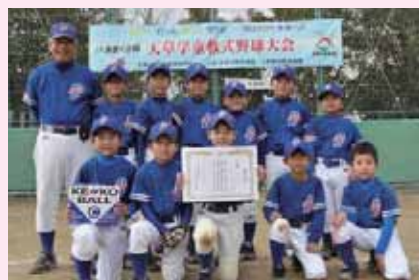
準優勝=ブルーアマックス