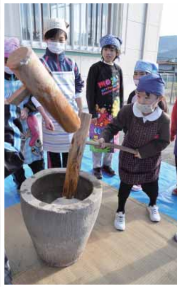
一生懸命にもちをつく児童ら