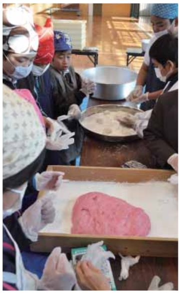
ついたもちはみんなであめました

餅つきは当時のPTA会長の提案で行われ、今回で2回目。青壮年部から5名が参加し、きねの使い方やケガの注意点を説明しました。青壮年部員が実際にもちをつく所を見て、ケガをしないよう声を掛けあいながら児童も餅つきに挑戦しました。参加した児童は「きねが重かったけど楽しかった。」と笑顔で話しました。ついた餅は、「きなこ」や「さとうしろう油」「チョコレート」など自分たちで選んだ食材と一緒につきたての餅の味を楽しみました。