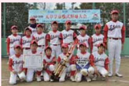
優勝=天草 Jr,スピリッツ