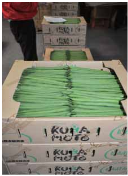
キレイに箱詰めされたインゲン