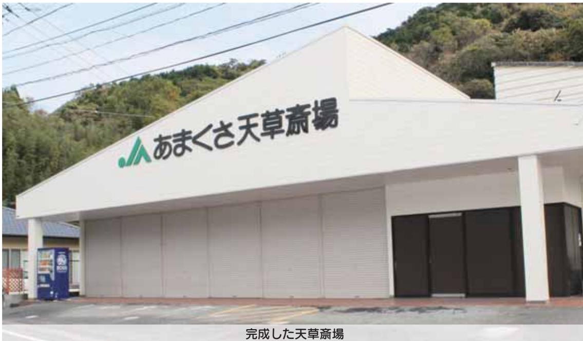
完成した天草斎場